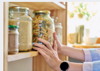
2 kg Nudeln statt 4 x 500g