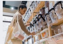
Unverpackt kaufen statt Gemüse, Käse, Wurst etc. in Plastik