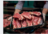
Metzger oder Fleisch-Theke statt Plastikflut

Hier gibt es hilfreiche Tipps rund um Nachhaltigkeit und Abfallvermeidung!