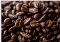
Café-Pulver/-Bohnen statt Kapseln

Hier erfährst du, wo sich mit weniger Verpackungsmüll einkaufen lässt.