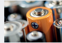
Akkus statt Batterien