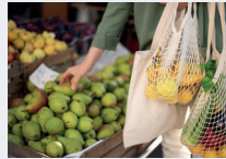
Ein Stoffbeutel statt 30 Plastiktüten