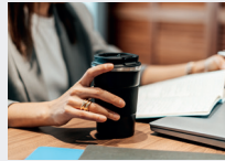
Thermobecher statt auslaufender Pappbecher