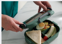
Brotbox statt Alufolie oder Papier