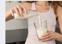
Joghurt, Milch und Wasser im Glas statt Tetra Pak