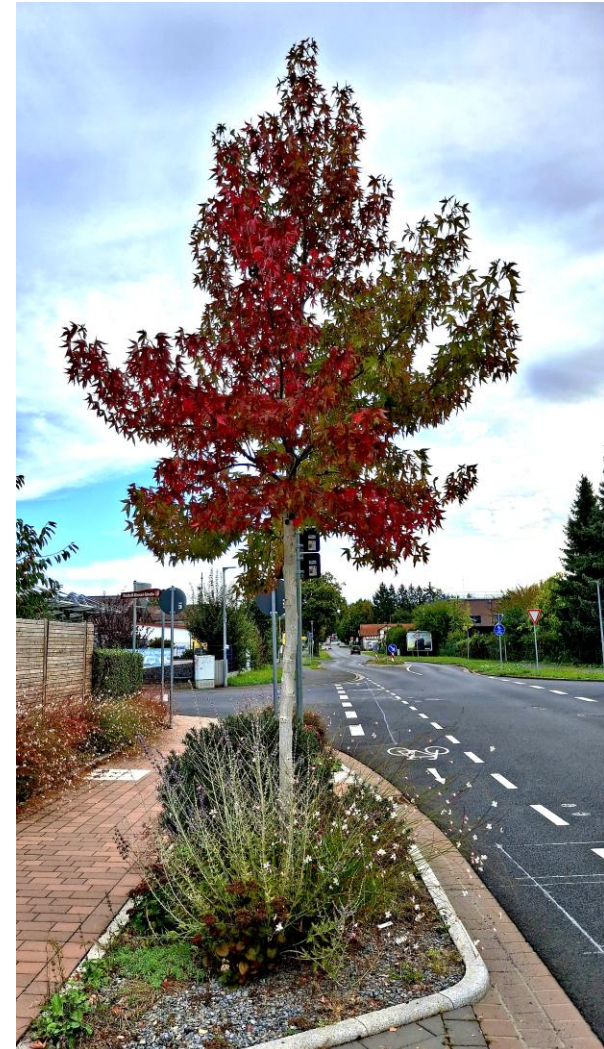
Amberbaum in Hösbach